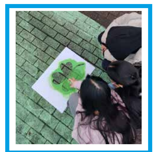
Jugendliche haben die temporäre Bodenbemalung aktiv mitgestaltet.

Die temporäre Gestaltung wird von der Eigentümerin des EKZ sowie mit RISE-Fördermitteln umgesetzt.