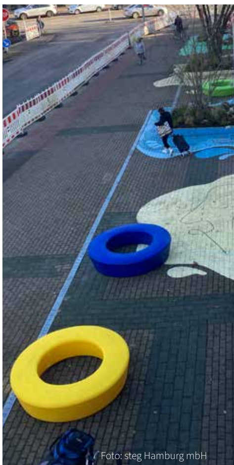
Neugestaltung temporärer Quartiersplatz

In den letzten Monaten wurde die temporäre Gestaltung des Quartiersplatzes am nördlichen Ausgang des Einkaufszentrums schrittweise umgesetzt.