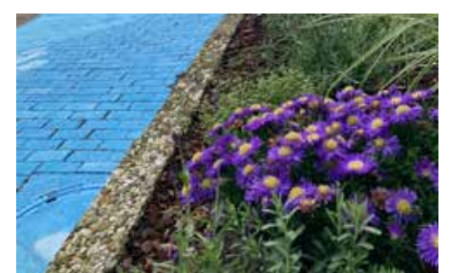
Neubepflanzung der Beete