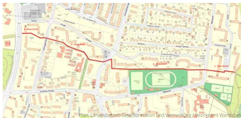
Plan: Landesbetrieb Geoinformation und Vermessung / Bezirksamt Wandsbek